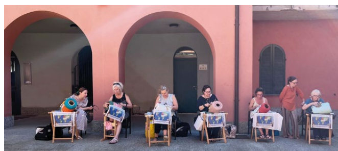
Ricordo della scorsa edizione 2023